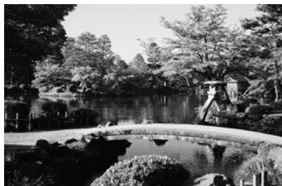
Kenrokuen, one of Japan's three most outstanding gardens If you show proof of residence (such as your residence card), you can enter for free on weekends.