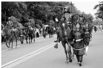
On the first Saturday of June every year, a grand festival called the Kanazawa Hyakumangoku Festival is held.

Kanazawa is blessed with natural waterways and greenery, with its mountains, nearby sea, and the Saigawa and Asanogawa rivers flowing down between three mountains. It's a place where you can experience the fascinating beauty of all four seasons. A city that prospered as a castle town under the Kaga Domain Maeda family, Kanazawa has deep cultural and scholarly roots. It has inherited many traditional art forms, including crafts such as Kaga Yuzen, gold leaf art, Kutani-ware (porcelain) and lacquer ware, as well as entertainment, including Noh theatre and Kaga-manzai (folk art). In June 2009, Kanazawa was recognized as the world's first UNESCO Creative City in the field of Crafts and Folk Art. In addition, because it escaped damage from natural disasters and war, even today many historical structures and townscapes remain. In Kanazawa, these assets are carefully preserved. In order to continue making Kanazawa a place its citizens can be proud of, we are looking to the future and aim to establish Kanazawa as a global "hub of international exchange" while striving to create an easy-to-live society for everyone.