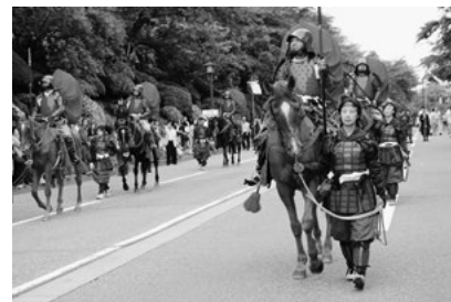
毎年6月の第1土曜日に「金沢百万石まつり」が盛大に行われます。

金沢市では、これらの資産を大切に、市民が誇れるまちであり続けるために、未来を見据え、世界の「交流拠点都市金沢」の実現をめざすとともに、誰もが暮らしやすいまちづくりの推進に取り組んでいます。