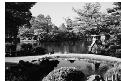
日本三名園の一つ「兼六園」 在留カードなど住所がわかるものを提示すれば、 週末は無料で入園できます。